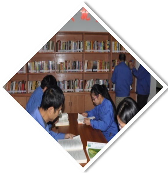
图表2.1-7 学习方式及渠道