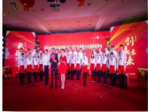
图6.2-2 a) 文体活动