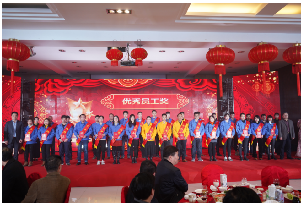
图表2.1-5 优秀员工表彰

物质激励：为鼓励全体员工实现卓越绩效的活动，强化公司未来的发展方向和发展重点，公司设立了优秀员工、优秀团队奖等荣誉，为员工的优秀表现给予精神奖励及物质奖励。在供应商与顾客方面，公司定期评级，根据评级结果相应提供增值性服务，以增进双方友谊，朝着对双方都有利的方向迈进。