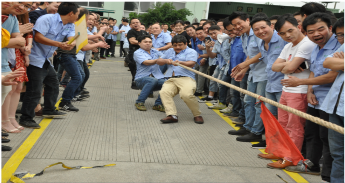
图6.2-2 c) 文体活动